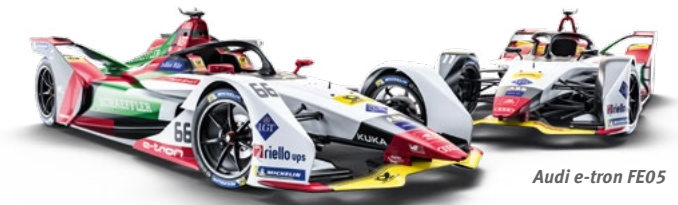
Audi e-tron FE05

Punktesystem 1. 25 Pkt. 2. 18 Pkt. 3. 15 Pkt. 4. 12 Pkt. 5. 10 Pkt. 6. 8 Pkt. 7. 6 Pkt. 8. 4 Pkt. 9. 2 Pkt. 10. 1 Pkt.