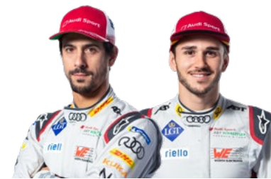
Lucas di Grassi